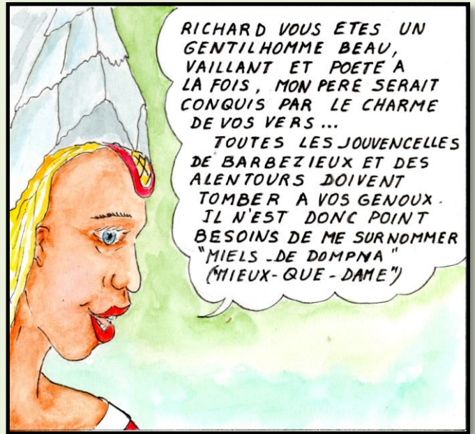
UN MOIS PLUS TARD AU CHATEAU DE TONNAY

RICHARD VOUS ETES UN GENTILHOMME BEAU, VAILLANT ET POETE A LA FOIS, MON PERE SERAIT CONQUIS PAR LE CHARME DE VOS VERS ... TOUTES LES JOUVENCELLES DE BARBEZIEUX ET DES ALENTOURS DOIVENT TOMBER A VOS GENOUX. IL N'EST DONC POINT BESOINS DE ME SURNOMMER "MIELS-DE-DOMPNA" (MIEUX-QUE-DAME)